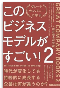
ビジネスモデル変革 BX